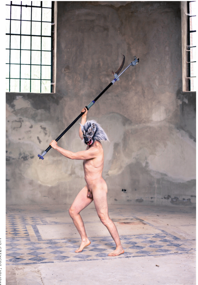
Warrior, 185x125 cm